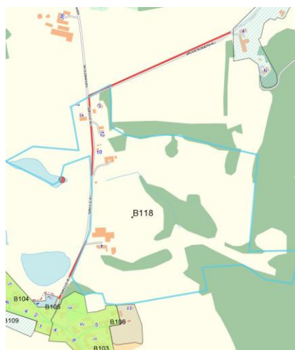
Figur 1. Plantegning

Ejendomme i oplandet skal selv håndtere regnvandet, f. eks ved nedsivning i faskiner.